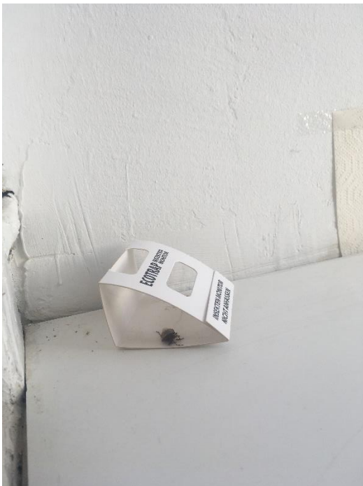
8. kép: Kihelyezett rovarcsapda a Vármúzeum tornyában az ablakok között