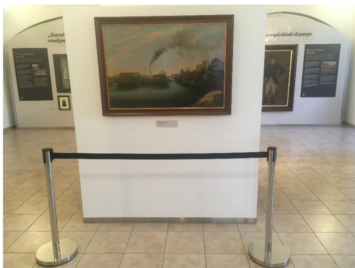
2. kép: szalagos kordonoszlop alkalmazása a Vármúzeum Géniusz kiállításában