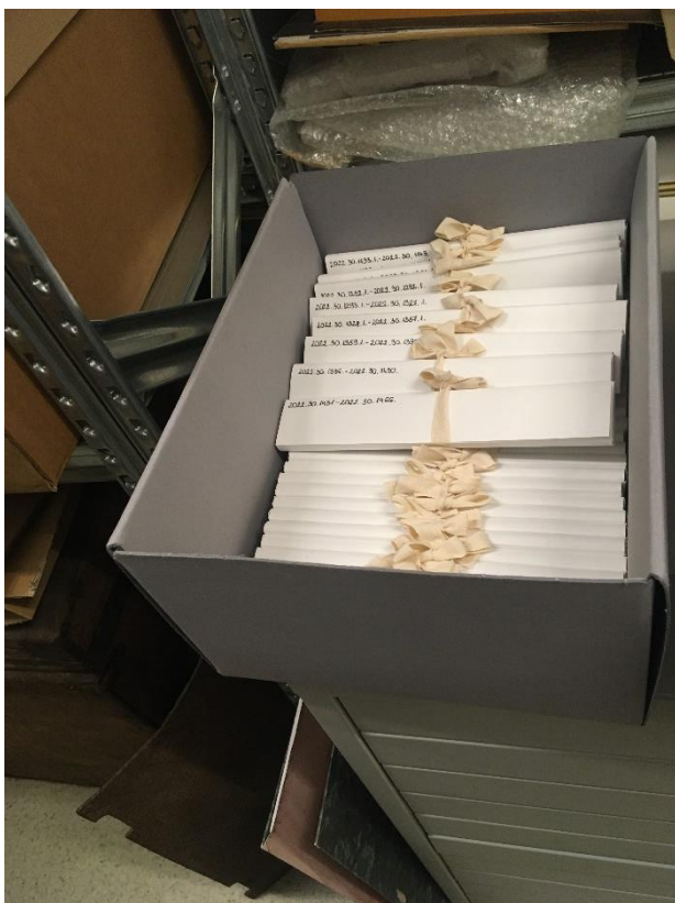
4. kép: LORELEY II. tárolódoboz