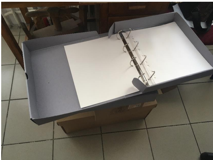
3. kép: PAD lefűzhető tároló