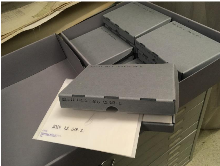
6. kép: kagylós nyílású dobozok