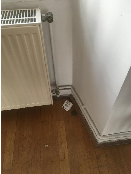
7. kép: Kihelyezett rovarcsapda a Vármúzeum tornyában