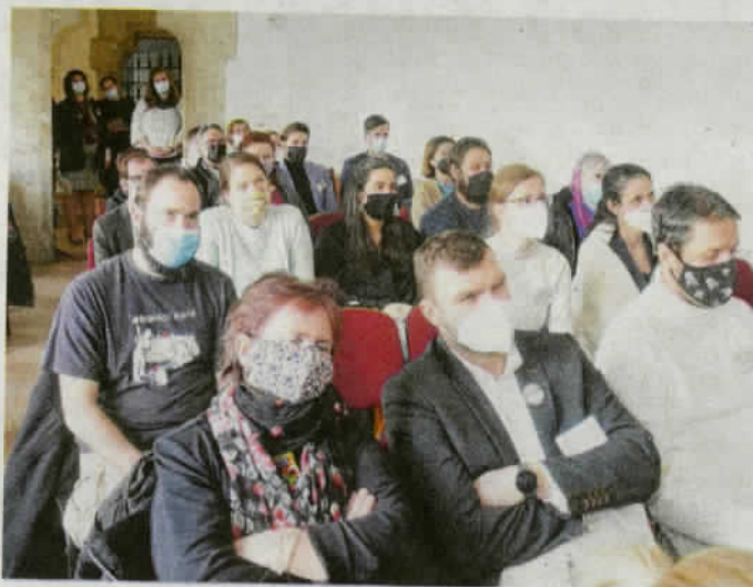
Két nap alatt közel 40 előadás hangzott el a konferencián.