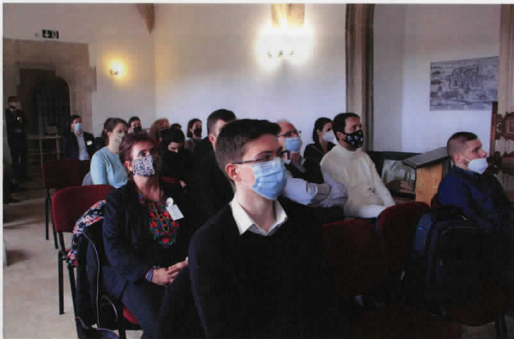
Előadók és nézőközönség a második konferencianapon