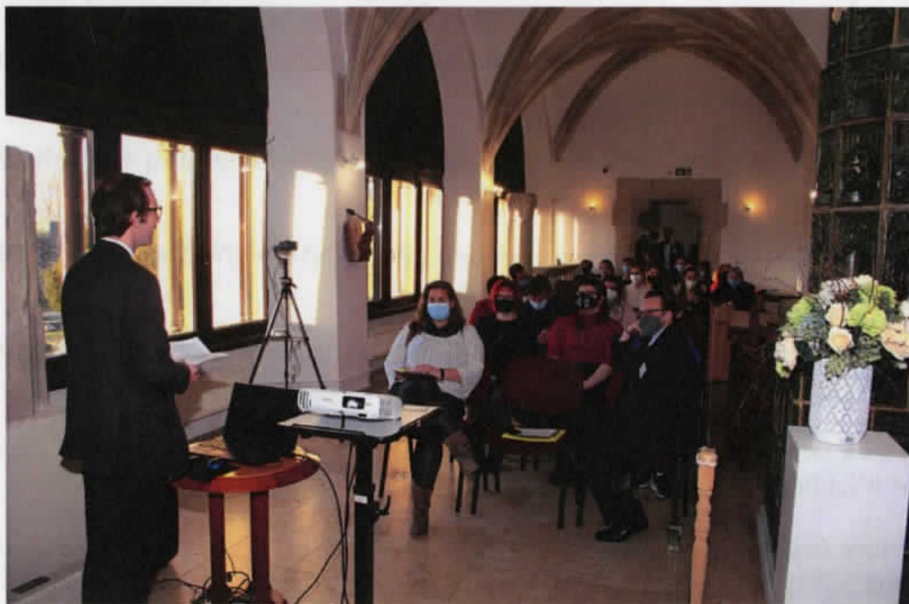
Nézőközönség a konferencia második napján