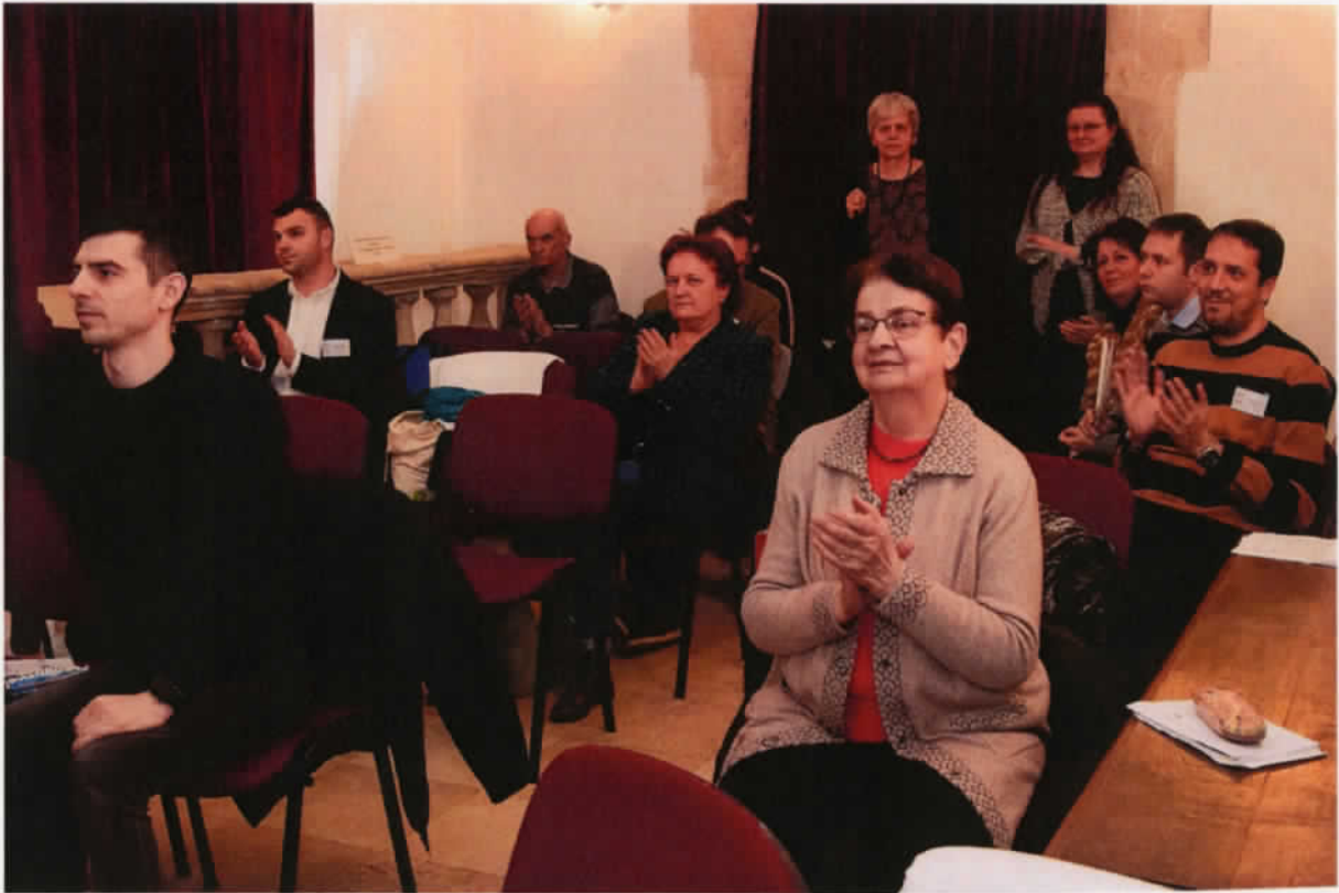
A konferencia zárása