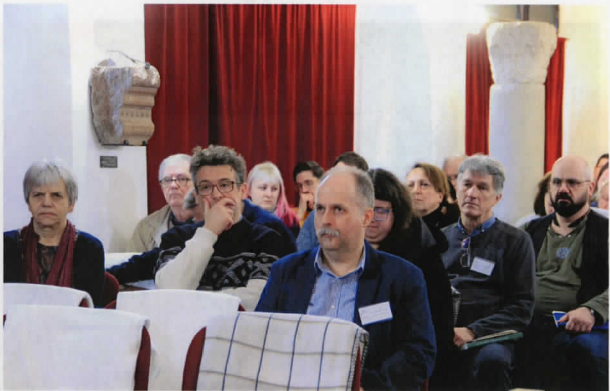
A konferencia előadói és nézőközönsége a második konferencianapon